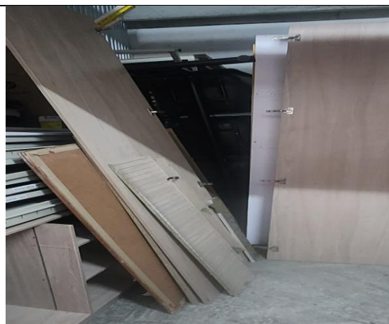
Tablones de madera