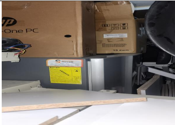
Nevera descompuesta marca HACEB