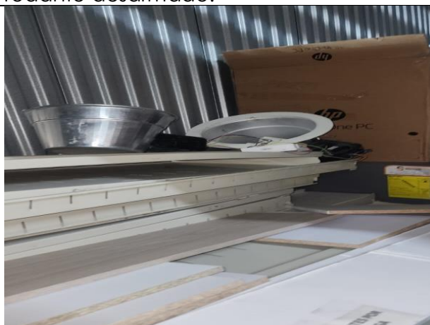
Lámparas dañadas y partes desarmadas del archivo rodante