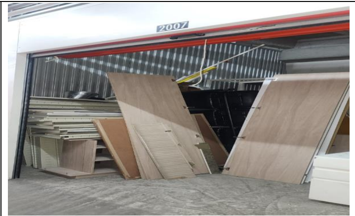
Estado actual del almacenamiento en la bodega.

La invitación consiste en que la ESAL que esté interesada en RECIBIR TODOS los bienes anteriormente descritos, se acoja al procedimiento de donación que estipula la Junta Regional de Calificación de Invalidez de Antioquia, teniendo en cuenta los siguientes aspectos: