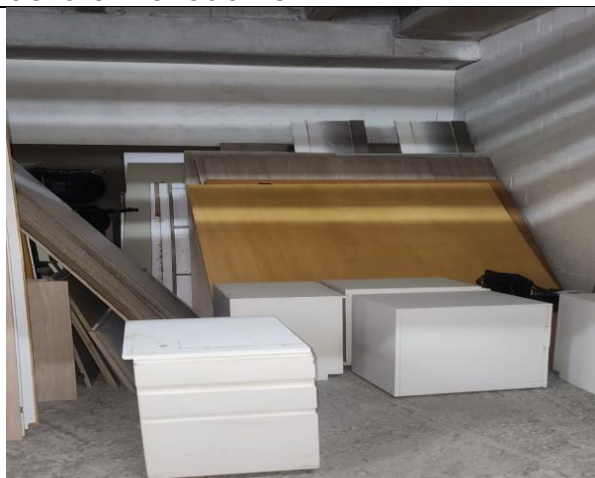
Mesas de Juntas (tablas grandes) y archivadores blancos en mal estado