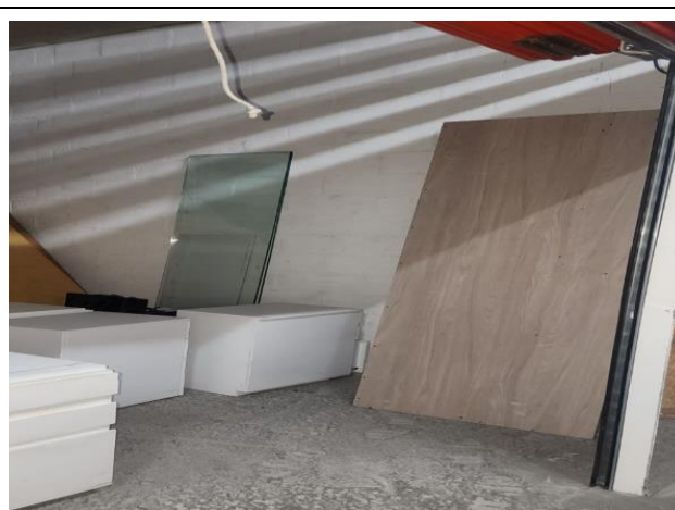
Tablas de madera, archivadores blancos en mal estado y vidrios de recepción.