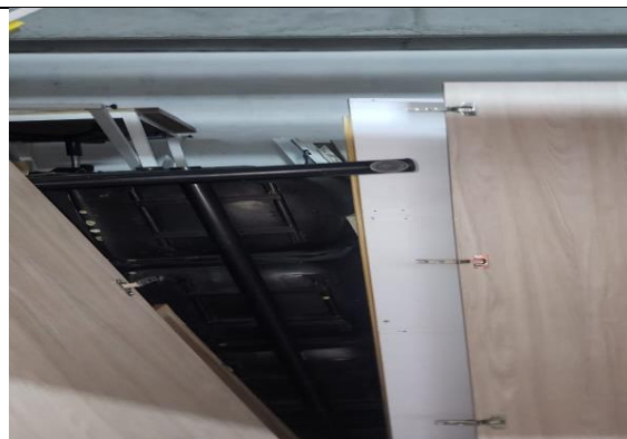
Tablas de madera y sillas viejas de recepción.