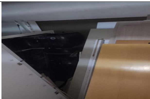
Tablas de madera y partes de archivador rodante desarmado.